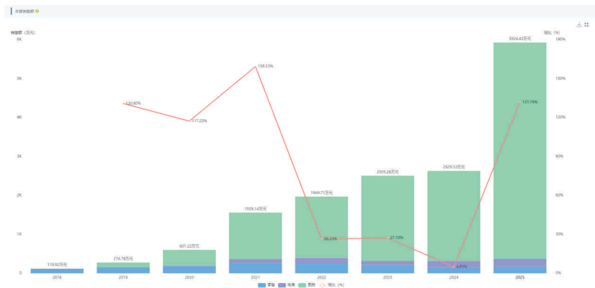
酒石酸西尼必利片国内市场趋势

根据药智数据统计，酒石酸西尼必利片的国内销售额从2021年的1500万元增长到2025年近6000万元，年增长率最高达到132%，显示出强劲的增长势头。